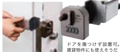
ドアを傷つけず設置可。 賃貸物件にも使える

実勢価格 3045円 | SPEC ●サイズ：取り付け金具：幅40×長さ151×厚み27ミリ、ダイヤルロック部：幅57×高さ63×厚み21ミリ