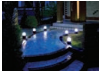
安全と安心のために暗い場所に活用したい

面倒な配線不要のセンサーライト。人の動きに反応して点くから経済的で、テラスや玄関の防犯に最適だ。電池式でどこにでも設置できるため家の中にも使うという手も。埋め込み型や壁掛けタイプなどもある。