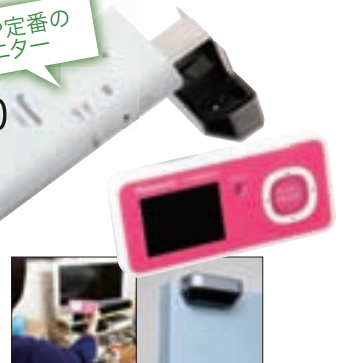
カメラを設置すると専用モニターに外の映像を映しだせるという優れ物

玄関先まで行かないでもドアの外が見渡せるお手軽モニター。工事不要で設置も簡単なワイヤレスタイプだ。価格もお手頃で防犯グッズ初心者にもぴったり。